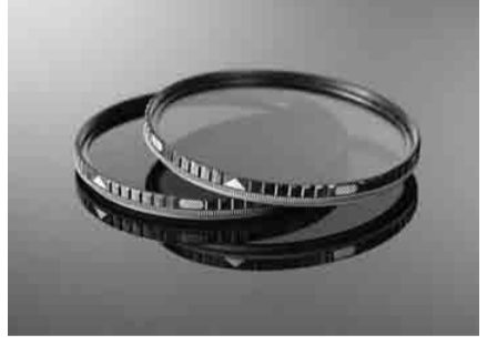
Breakthrough Filters社のフィルター製品

「1」24日/12時10分-12時50分 自然写真家・田中雅美氏、イメージコ 「2」24日/14時30分-15時10分 最新のハイパフォーマンスなFlash Storageについて 「3」24日/16時50分-17時30分 Exacand社CEO/CTOのFrank Chen氏による最新のハイパフォーマンスなFlash Storageについて 「4」24日/18時30分-19時10分 最新のハイパフォーマンスなFlash Storageについて