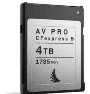
AV PRO CFEXPRESS MK2 (4TB)

「1」24日/12時10分-12時50分 自然写真家・田中雅美氏、イメージコ 「2」24日/14時30分-15時10分 最新のハイパフォーマンスなFlash Storageについて 「3」24日/16時50分-17時30分 Exacand社CEO/CTOのFrank Chen氏による最新のハイパフォーマンスなFlash Storageについて 「4」24日/18時30分-19時10分 最新のハイパフォーマンスなFlash Storageについて